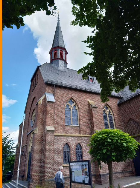
Sankt Maria Rosenkranzkönigin in Meindorf